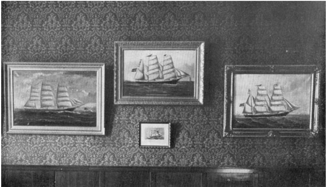
Fregatskib "Herkules". Barkskib "Norske Veritas". Bark "Mercurius" Fregatskib "Benmore".